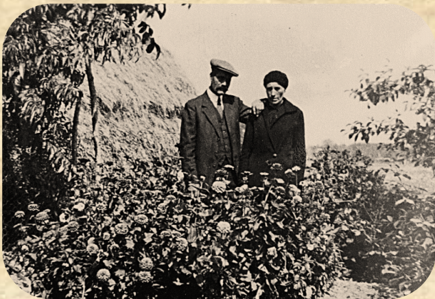
Santeau (Loiret), en 1959

En 1959 les grandes vacances duraient 3 mois et mes parents, coiffeurs à Nogent-sur-Vernisson, ne pouvaient s'occuper de leurs trois chérubins pendant cette période. Nous étions répartis dans la famille et, moi, je les passais chez les parents de mon père qui possédaient une ferme à Santeau, au lieu-dit " le Vieux Santeau ", près de Chilleurs-aux-Bois